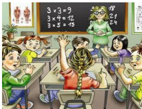
Imagen extraída de Casa del Saber, tercero básico.

26. De acuerdo a las imágenes, ¿qué elemento ha permanecido en el tiempo?